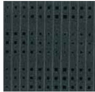
Velours King Cab und Double Cab