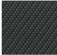
Stoff Single Cab