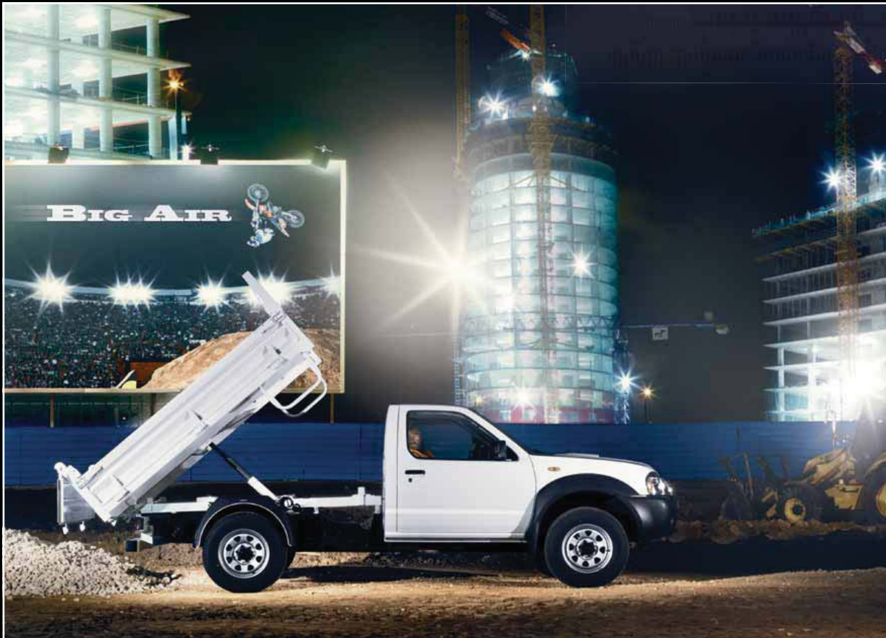
NISSAN NP300 PICK UP Fahrgestell mit Kipper-Aufbau