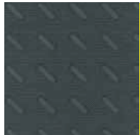
Jersey Double Cab mit Business-Plus-Paket